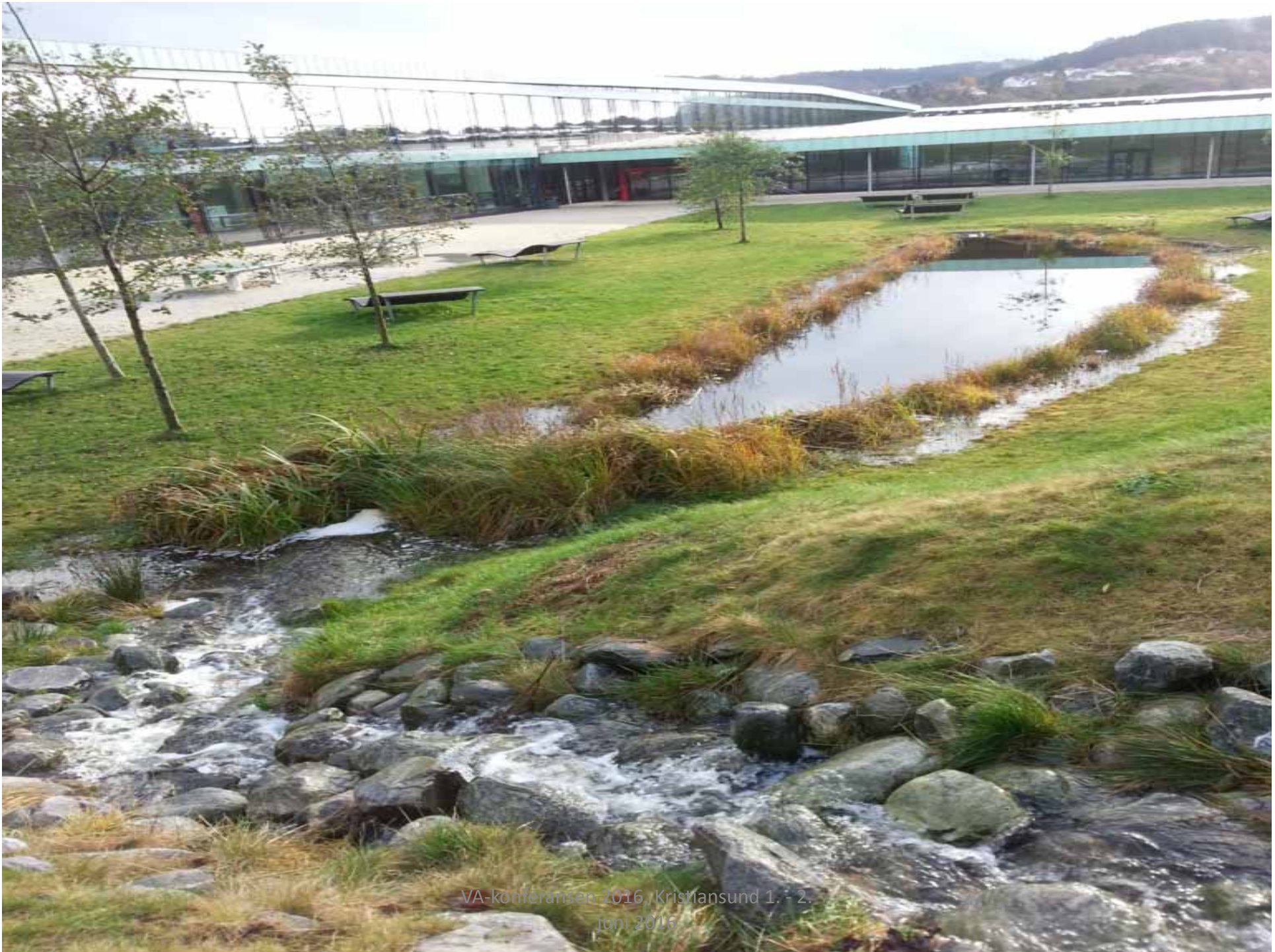
VA-konferansen 2016, Kristiansund 1. - 2. juni 2016