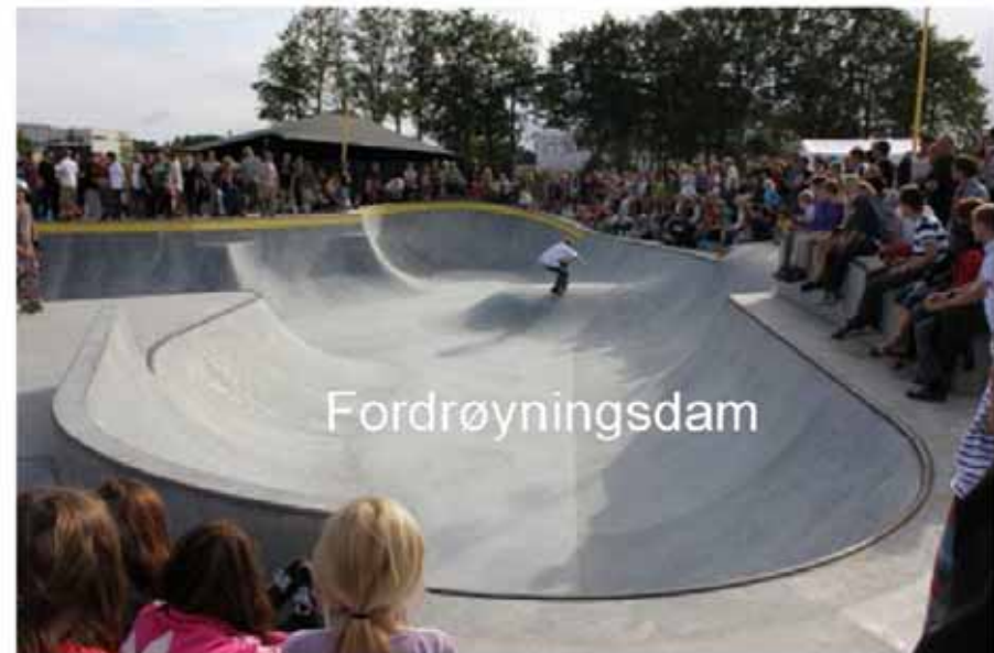
Figur 12. Flerbruk av skateanlegg til flomkanal og fordrøyningsbasseng i Roskilde.