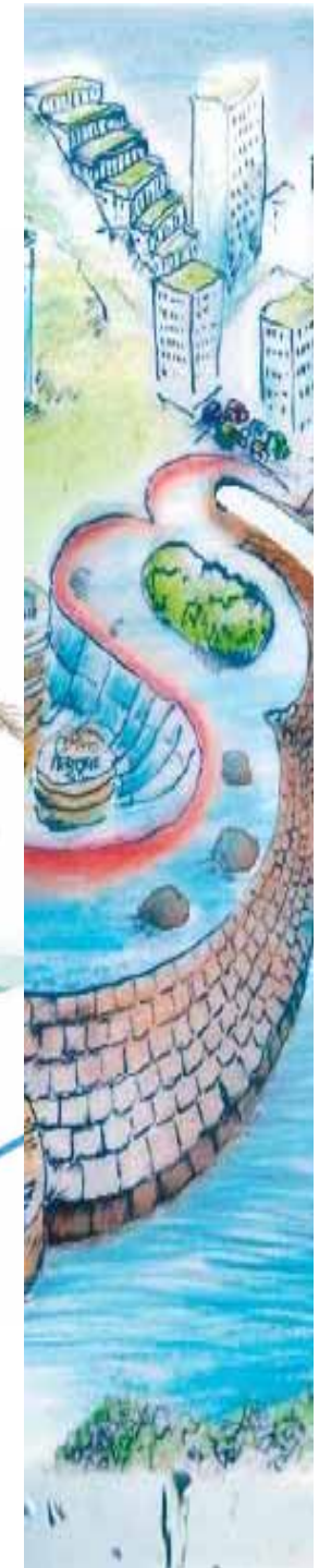
Illustrasjon: Prathepa Kirubaharan, landskapsarkitektstudent, NMBU.